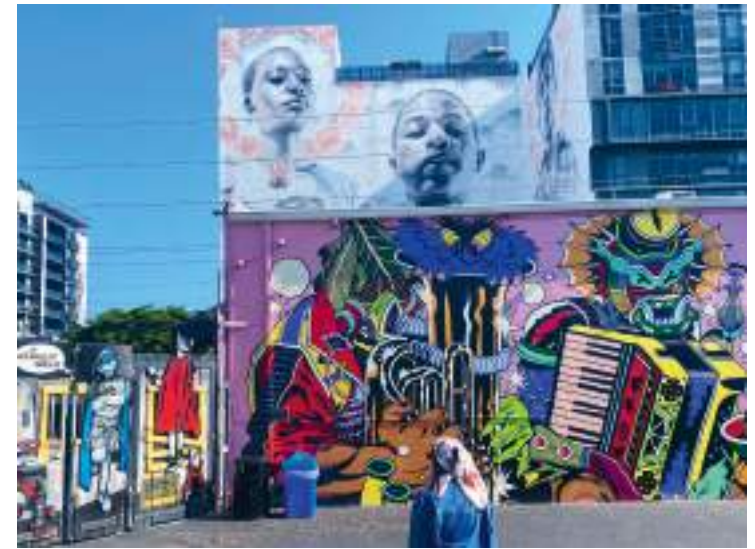
↑ "A Love Supreme" av Miles MacGregor i Wynwood Walls, Miami.