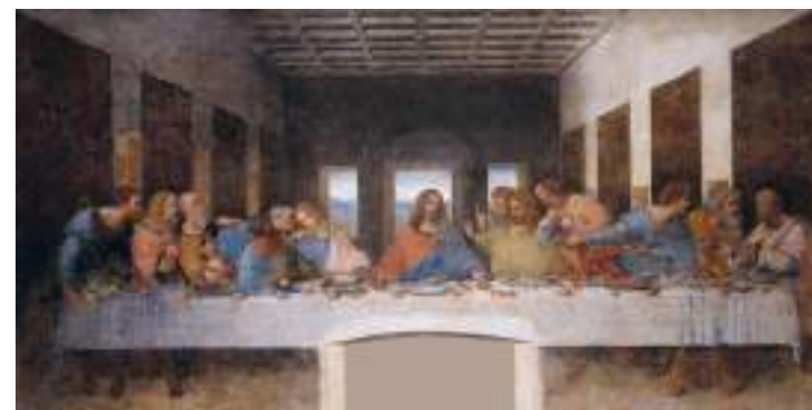
↑ "Nattvarden" av Leonardo da Vinci år 1495.