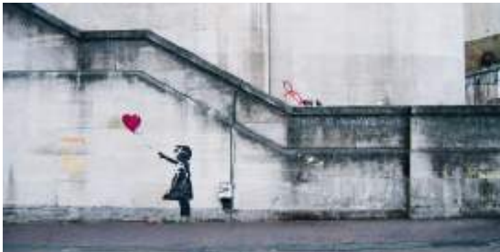
↑ "Girl and Heart Balloon" av Banksy.