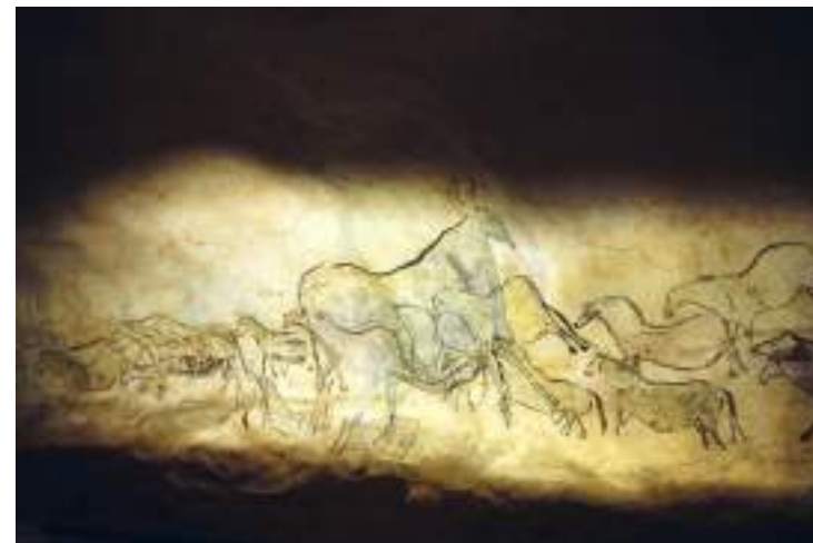
↑ "Lascaux IV", 20 000 år gammal väggmålning.