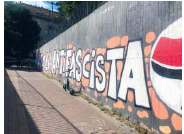
↑ "Reggio Emilia Antifascista" i Reggio Emilia, upphovsperson okänd.