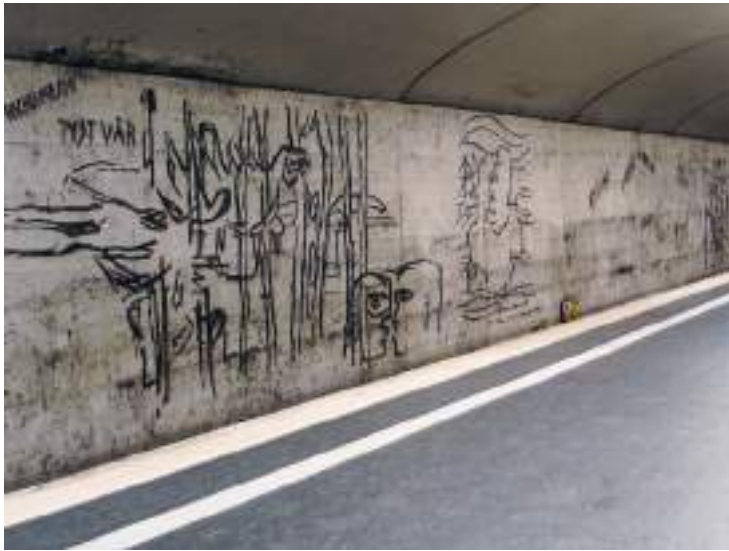
↑ "Ristningar i betong" av Siri Derkert i Östermalmstorgs tunnelbanestation.